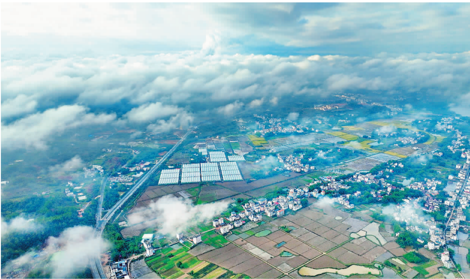
江西省赣州市信丰县的冬日村景。