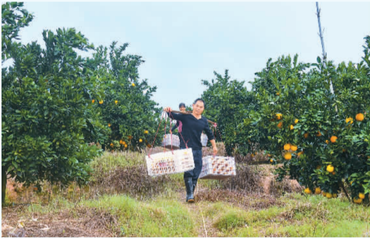
信丰县脐橙进入收获季。