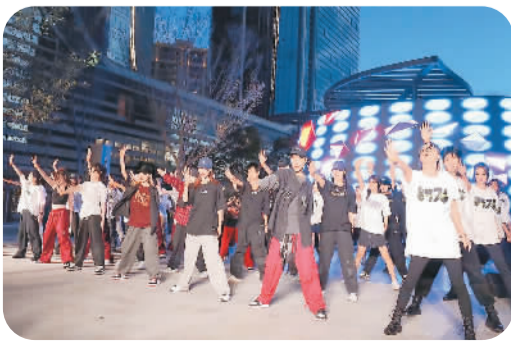
游客与市民一起跳街舞。

嘻哈舞、技巧舞、机械舞、爵士舞，各种舞蹈在浙江省台州市椒江区腾达中心广场花式上演，台上的演员随着强劲的乐曲起舞，台下的观