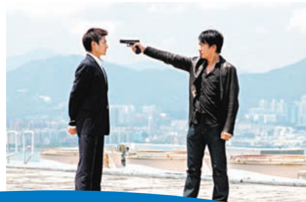
▼今年是《無間道》上畫20周年。