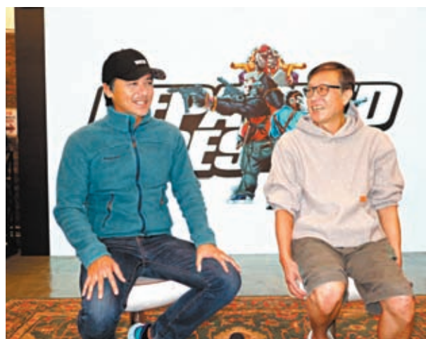
◆劉偉強與馮德倫8日出席對談。