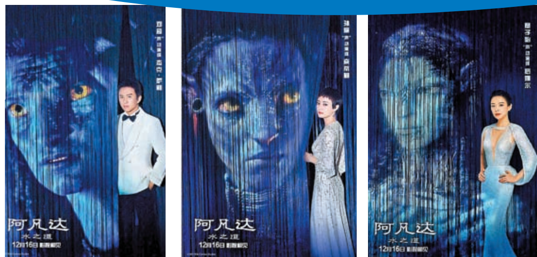
◆鄧超為男主角Jake Sully配音。