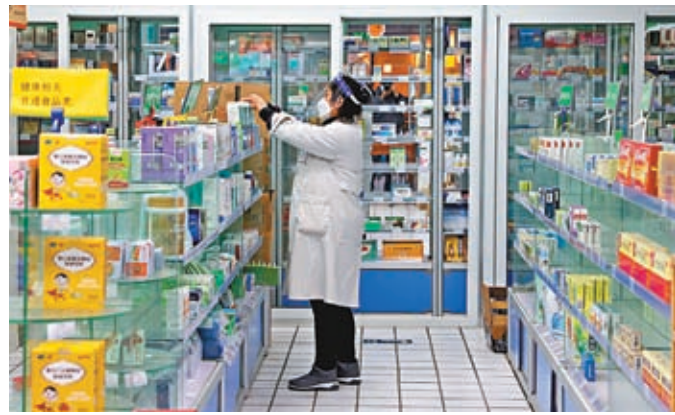
◆「新十條」第五條措施提出「保障民眾基本購藥需求」，各地藥店要正常運營，不得隨意關停。不得限制民眾線上線下購買退熱、止咳、抗病毒、治感冒等非處方藥物。圖爲12月7日北京一家藥店的工作人員在整理藥品。

「將新冠肺炎回歸到乙類管理，可以將大量的醫療資源從方艙醫院中釋放出來，回歸到正常的診療中；在搶救新冠患者中，可以將精力重點放在重點人群上；也可以爲未來進一步優化防控措施提供一定的法律依據，做到有法可依。」張伯禮告訴香港文匯報記者，把新冠肺炎降級管控的舉措，是疫情防控的重大調整，相信主管部門一定會根據病毒變異及疫情變化綜合研判，以變應變，適時有序作出調整。