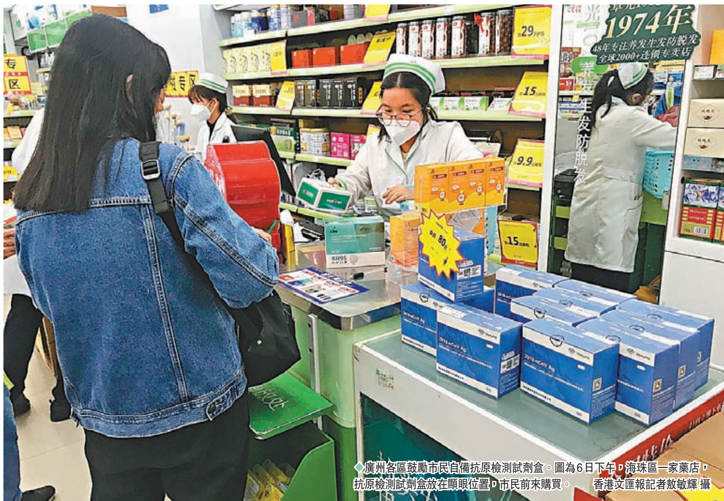
◆廣州各區鼓勵市民自備抗原檢測試劑盒。圖為6日下午，海珠區一家藥店，抗原檢測試劑盒放在顯眼位置，市民前來購買。

政府的優化措施也在不斷細化。本周以來，國務院聯防聯控機制陸續推出包括「新十條」、《關於進一步優化發熱患者就診流程的通知》等在內的六個文件，內容涉及居家隔離、醫療分流、抗原檢測等細項，為優化防控編制更有序細密的規則網絡。除抗原自測外，國務院聯防聯控機制8日亦下發居家治療指南。