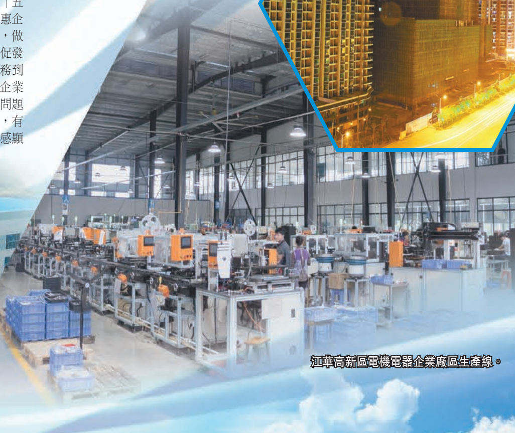
江華高新區電機電器企業廠區生產線。