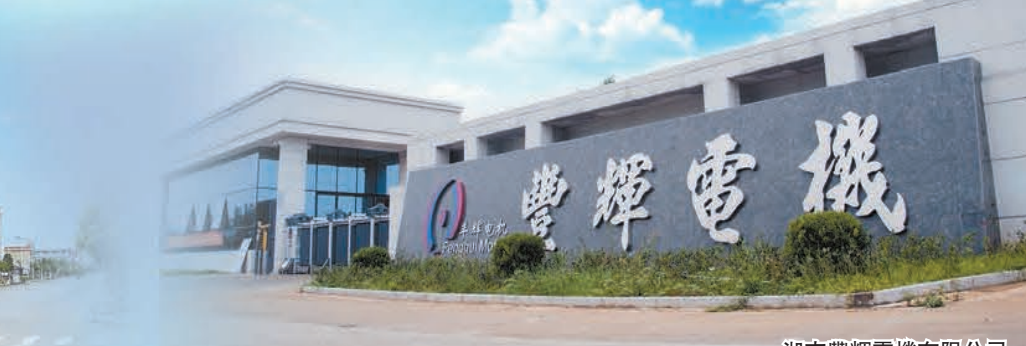
湖南豐輝電機有限公司。