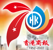
湖南省級示範物流園，江華縣綜合性現代物流園。