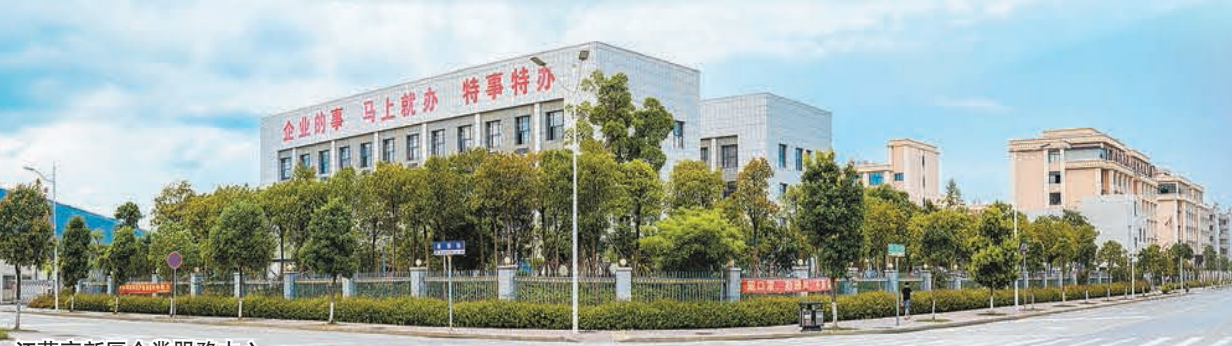
江華高新區企業服務中心。