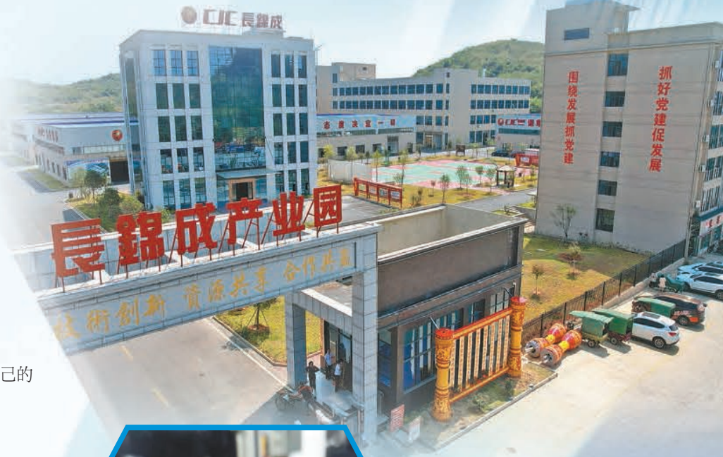
▲江華高新區電機電器產業代表企業：湖南長錦成電器有限公司，其合作研發的高分子材料，經多項檢測可替代進口材料，市場潛力巨大。

江華縣緊隨省市聯企行動開展步伐，扎實開展「百名幹部聯百企」行動。突出行動響應「快」、走訪服務「暖」、政策落實「細」、問題解決「實」、優化環境「立」的「五字」方針，着力解決企業生產和發展中的困難，共印發惠企政策「口袋書」300餘冊，聯企幹部入企宣傳800餘次，做好為企業送政策的「服務員」、穩增長的「智囊團」、促發展的「先鋒隊」。嚴格落實責任到人、調研到底、服務到位、成效到家的工作要求，累計走訪（含座談）264家企業和60個重點項目，摸排、梳理出問題261個，即時解決問題150個，協調解決問題109個，建立聯企活動長效機制，有力幫助市場主體緩解生產經營壓力，企業獲得感和幸福顯著提升。