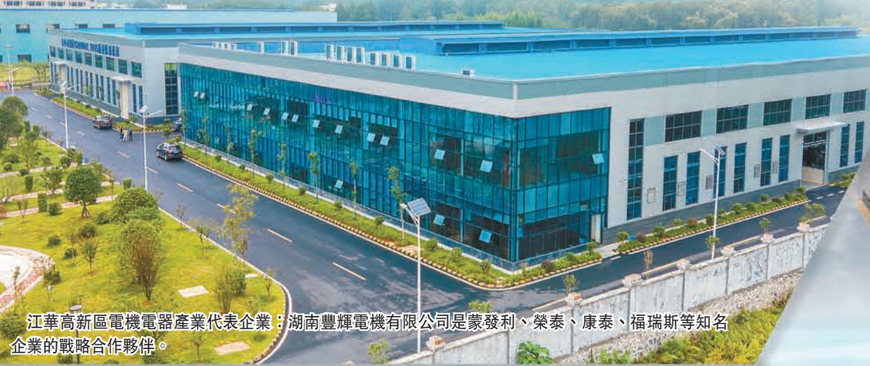
江華高新區電機電器產業代表企業：湖南豐輝電機有限公司是蒙發利、榮泰、康泰、福瑞斯等知名企業的戰略合作夥伴。