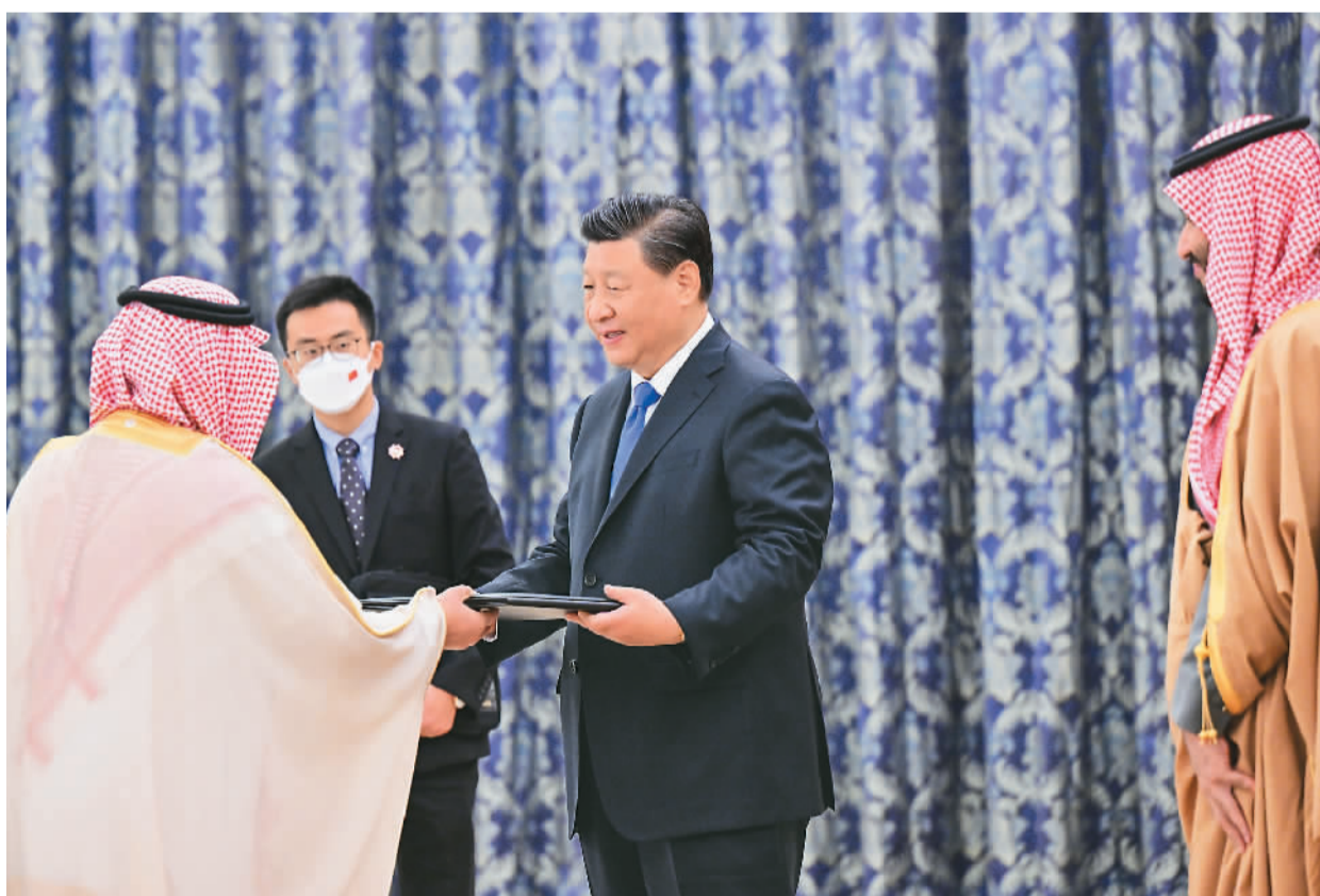
当地时间12月8日下午, 国家主席习近平在利雅得王宫出席苏欧德国王大学名誉博士学位授予仪式。沙特王储兼首相穆罕默德陪同出席仪式。