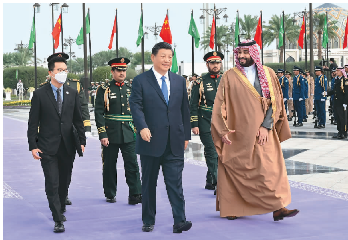
当地时间12月8日中午, 沙特王储兼首相穆罕默德代表国王萨勒曼为正在沙特进行国事访问的国家主席习近平在利雅得王宫举行欢迎仪式。