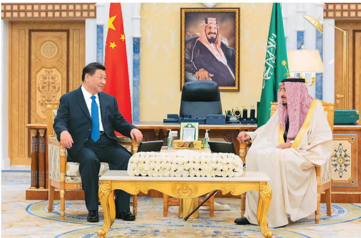
当地时间12月8日下午, 国家主席习近平在利雅得王宫会见沙特国王萨勒曼。