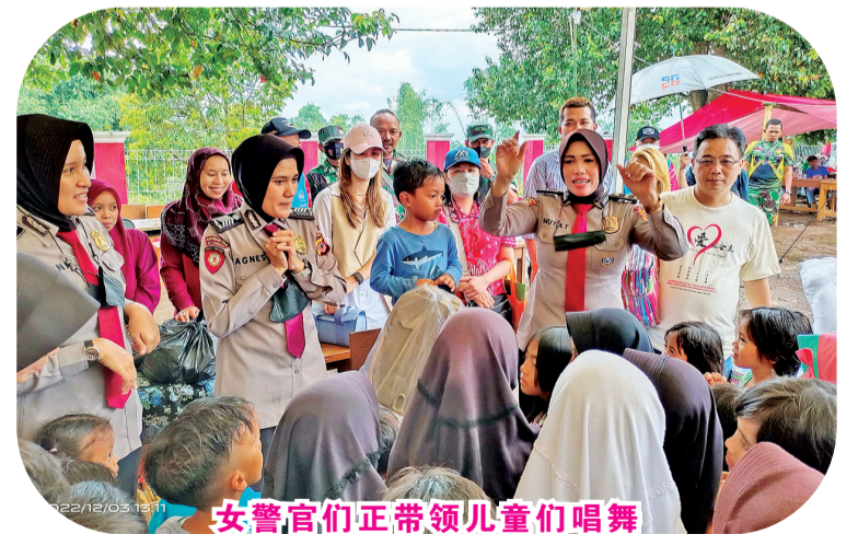
女警官们正带领儿童们唱舞