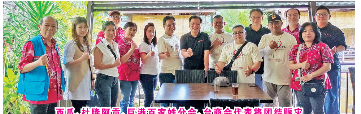
西瓜、杜隆阿贡、巨港百家姓分会、台商会代表将团结赈灾

【万隆讯】印华百家姓协会西瓜哇分会(PSMTI Jabar)还是和万隆关怀团队(MTP)、人民思潮报(PR)、军区、警察局合作,也委托展玉百家姓分会关注灾情,察看灾民的需要。由西瓜哇百家姓提供赈灾物资,由他们安排和军警合作,送达灾民手中。前次灾区需要大水箱储存食用水和大米等,也已经给他们送去30个大水箱和大米,放在30个救助站。