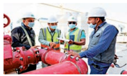
◆ 10月1日，工作人員在沙特薩勒曼國王項目施工建設現場工作。