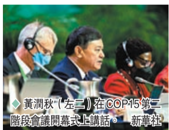
◆ 黃潤秋（左三）在COP15第二階段會議開幕式上講話。

香港文匯報訊 據新華社報道，聯合國《生物多樣性公約》締約方大會第十五次會議（COP15）第二階段會議於12月7日在加拿大蒙特利爾召開。中國外交部發言人毛寧7日在例行記者會上回答相關提問時表示，中方高度重視生物多樣性保護，自擔任COP15主席以來，一直以最高的政治意願和最強有力的務實行動推動COP15進程，為全球生物多樣性保護做出了積極貢獻。會議開幕前，大會主席、中國生態環境部部長黃潤秋對媒體表示，現在會議各項議程及籌備工作已準備就緒，參會各方都表現出了推動「2020年後全球生物多樣性框架」達成的強烈意願。