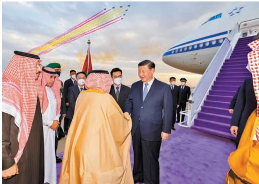
◆ 當地時間12月7日下午，中國國家主席習近平乘專機抵達利雅得。這是習近平乘專機抵達利雅得哈立德國王機場時，沙特利雅得省省長費薩爾親王、外交大臣費薩爾親王、中國事務大臣魯梅延等王室重要成員和政府高級官員熱情迎接。

香港文匯報訊 綜合新華社和中新社報道，當地時間12月7日下午，中國國家主席習近平乘專機抵達沙首都利雅得，應沙特阿拉伯國王薩勒曼邀請，出席首屆中國-阿拉伯國家峰會、中國-海灣阿拉伯國家合作委員會（海合會）峰會並對沙特進行國事訪問。習近平表示，中沙建交32年來，雙方戰略互信不斷鞏固，各領域務實合作成果豐碩。期待出席首屆中國-阿拉伯國家峰會和中國-海灣阿拉伯國家合作委員會峰會，同阿拉伯國家和海合會國家領導人一道，推動中阿、中海關係邁上新台階。