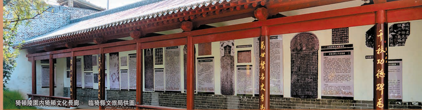
猗頓陵園內猗頓文化長廊。

幸福是奮鬥出來的。猗頓一生，通過自我不斷努力、奮鬥，不僅收獲了海量財富，實現了自己的人生價值，而且還給華夏商業史留下了濃墨重彩的一筆，難怪其能世世代代受到後人的尊崇和敬仰。