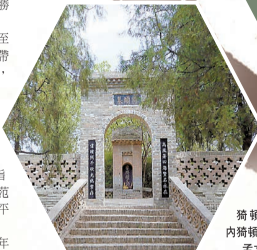
猗頓陵園內猗頓墓。