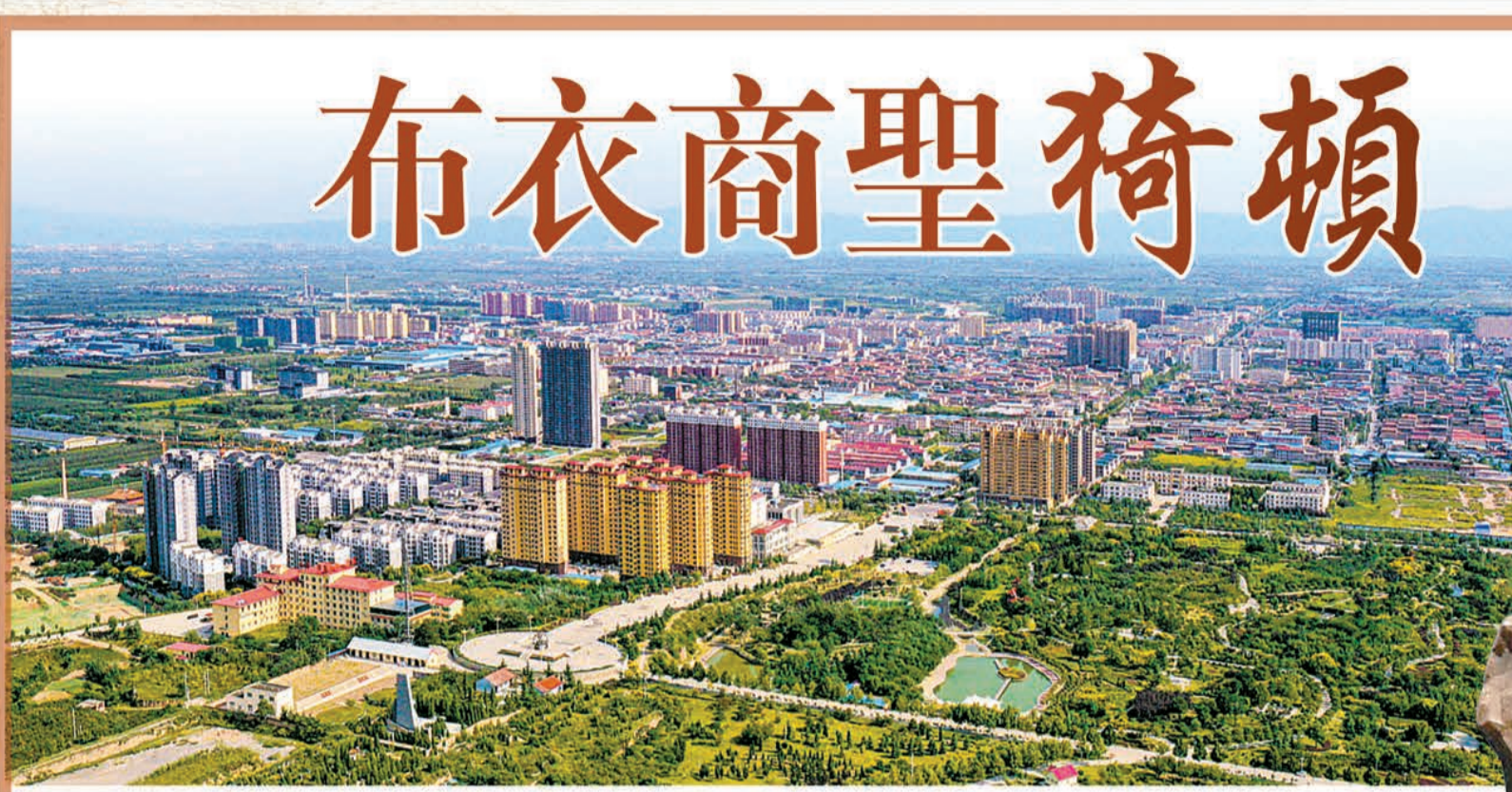
猗頓富可敵國的商业版圖在今山西省臨猗縣。