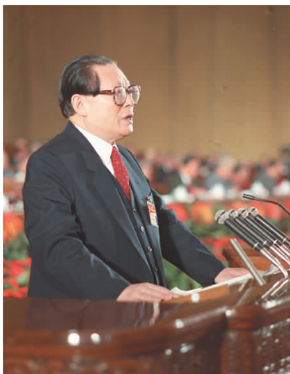
左图：1992年10月12日，中国共产党第十四次全国代表大会在北京人民大会堂开幕。这是江泽民同志代表第十三届中央委员会作报告。