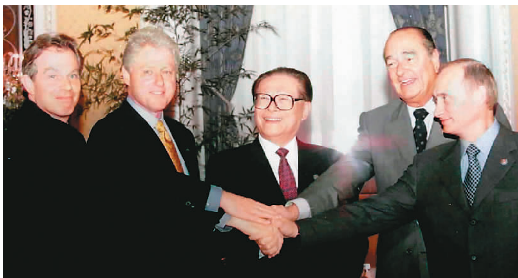
上图：2000年9月7日，由中国倡议的联合国安理会五个常任理事国首脑会议在纽约举行。江泽民同志（中）同法国总统希拉克（右二）、俄罗斯总统普京（右一）、英国首相布莱尔（左一）、美国总统克林顿（左二）握手合影。