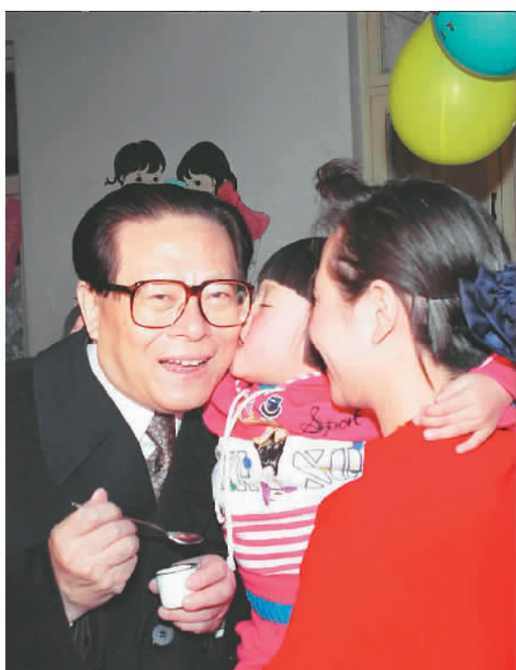
右图：1993年12月5日，江泽民同志在北京为一位幼儿园儿童喂服脊髓灰质炎疫苗后，小朋友亲吻江爷爷。