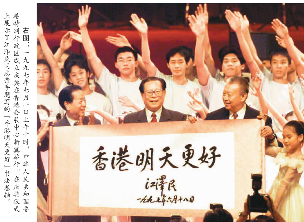
右图：一九九七年七月一日上午十时，中华人民共和国香港特别行政区成立庆典在香港会展中心新翼举行。在庆典仪式上展示了江泽民同志亲笔题写的“香港明天更好”书法卷轴。