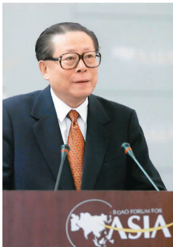
上图：2001年2月27日，博鳌亚洲论坛成立大会在海南举行。江泽民同志出席成立大会并致辞。