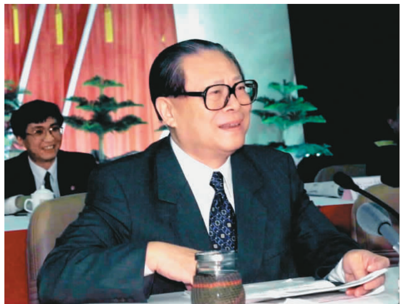
上图：2000年2月20日，江泽民同志在广东省高州市领导干部“三讲”教育会议上发表重要讲话。在这次广东考察中，江泽民同志提出，我们党总是代表着中国先进生产力的发展要求，代表着中国先进文化的前进方向，代表着中国最广大人民的根本利益。