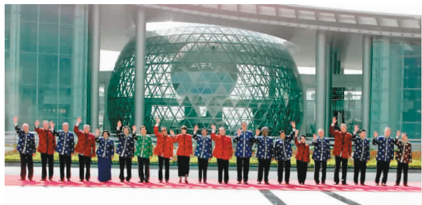
上图：2001年10月21日，亚太经合组织第九次领导人非正式会议在上海举行。这是江泽民同志与参会的经济体领导人合影。