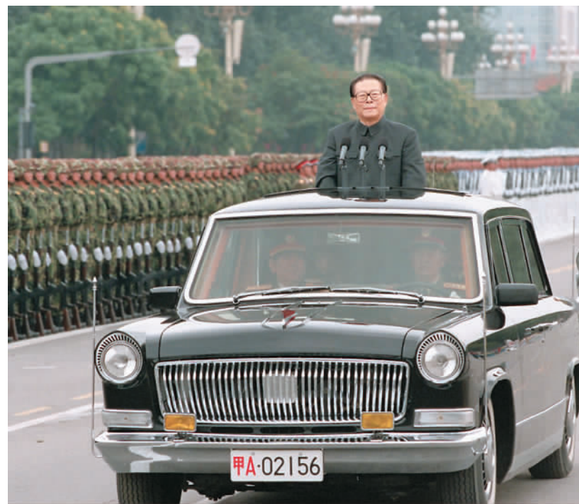
左图：一九九九年十月一日，中华人民共和国成立五十周年盛大庆典在北京天安门广场举行。江泽民同志检阅由人民解放军陆军海空三军和人民武装警察部队、民兵预备役部队组成的地面方队。