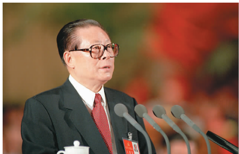
上图：1997年9月12日，中国共产党第十五次全国代表大会在北京人民大会堂开幕。这是江泽民同志代表第十四届中央委员会作报告。