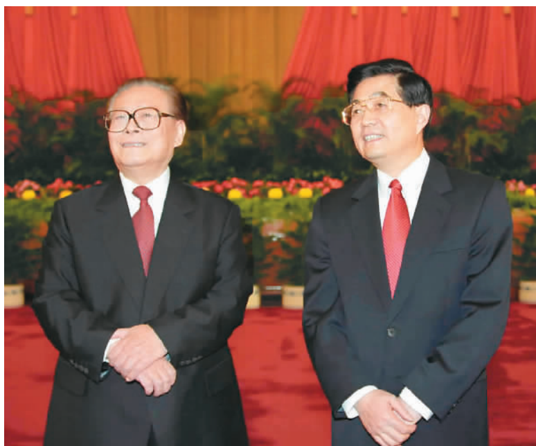
左图：2002年11月15日，江泽民同志、胡锦涛同志在北京人民大会堂亲切会见出席党的十六大代表、特邀代表和列席人员并发表重要讲话。