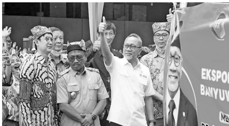
海洋渔业部保证渔业产品质量好

此前,内政部表示,由于涉嫌在苏富比礼宾拍卖网站上拍卖Widi群岛,北马鲁古省政府将冻结LII公司的营业许可证。(Irw)