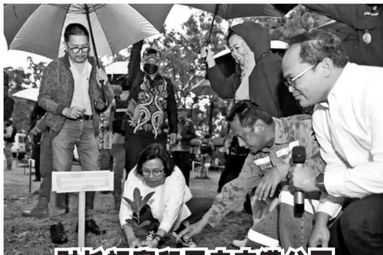
财长视察印尼自由港公司

据了解,徐比东房屋已被拟定为12个沿海旅游目的地之一,希望能招徕国内外游客前来观光。然而徐比东房屋周围没有停车场,因此游客可以在由当地居民安排的空地上停车,或可乘搭公共交通工具。(Ing)