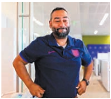
◆片中亞倫穿着英格蘭球衣。

交部為支持國家隊而拍攝，現實中當然沒有任何外交官被炒，一切都只是以幽默方式為球隊打氣。 ◆綜合報道