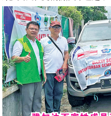
雅加达:百家姓成员直接到展玉灾区赈灾。

去的地方,不知道是不是属实,如果是事实,我们虽感到遗憾,但相信政府或区域灾害管理局(BPBD)会有更好的措施。可喜的是,来自各地各方善长仁翁继续汇到西瓜百家姓开通的网上赈灾户口。众人拾柴火焰高,能帮助更多赈灾的需要,也体现了很多人基于人道主义和慈悲怜悯之心伸手相助的美德。(雪妮报道)