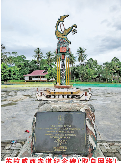
苏拉威西赤道纪念碑

隔天的第一站是一处风景秀丽的瀑布区。柴油将告罄的数辆车不敢随行,必须趁早赶去加油站排队等候。前往瀑布的车队很快就和排队等进油的车会合,下一站是经过苏拉威西的赤道线(Tugu Khatulistiwa Sulawesi),只见广场中央有一座高耸的纪念碑,用栏杆围着,石碑下的地面漆了一条粗黑的线,就是赤道线所在。队员有的爬上石碑,有的站在黑线上留影。北干巴鲁的赤道线我去过,这里反而没北干的热,或许是我们已习惯了一路的炎热气候吧。