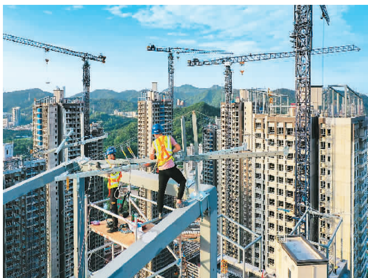
近日，在广东省深圳市福田区华富村棚改项目施工现场，工人在回迁安置房楼顶进行幕墙装配作业。

支持开发性政策性银行提供“保交楼”专项借款。《通知》提出，支持国家开发银行、农业发展银行按照有关政策安排和要求，依法合规、高效有序地向经复核备案的借款主体发放“保交