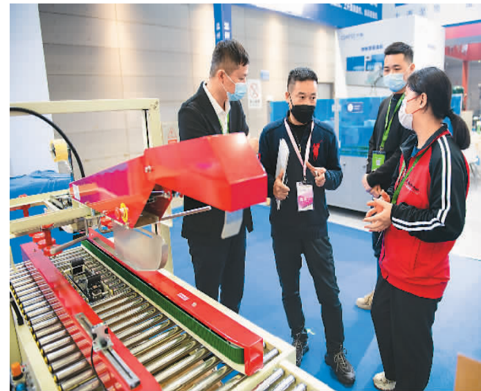
11月24日，由商务部、湖南省人民政府主办的2022（第七届）中国国际食品餐饮博览会在长沙国际会展中心开幕。本届博览会以“促进消费，创新发展”为主题，参与企业约1800家，集中展示了国内外食品餐饮行业发展成果。图为观众在长沙国际会展中心了解食品包装设备。