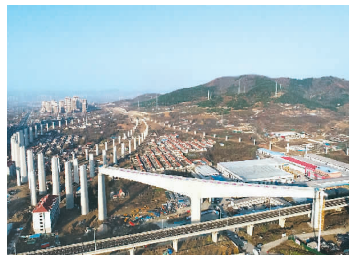
11月23日，由山东铁投集团投资建设、中铁上海工程局承建的潍烟铁路工程取得重要进展，两座万吨T构转体桥梁同时转体到达指定位置，成功跨越青荣城际铁路。潍烟铁路是国家“八纵八横”高铁主通道中沿海高铁通道的重要组成部分，通车后将加快山东半岛城市群互联互通，打造胶东半岛1小时、省内2小时、北京3小时的高质量交通圈。

去年以来，雄安新区承接疏解北京非首都功能不断取得突破，中国星网、中国中化、中国华能等3家央企总部开工建设，中矿集团完成选址，4所高校和2所医院选址落地，一批市场化疏解项目开工建设。央企在新区设立各类机构140多家。