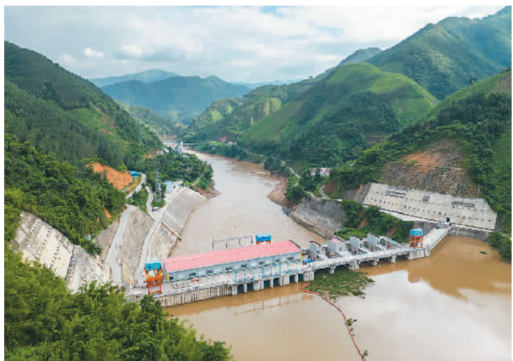
中国电建南欧江流域梯级水电项目位于老挝北部丰沙里省的四级电站。