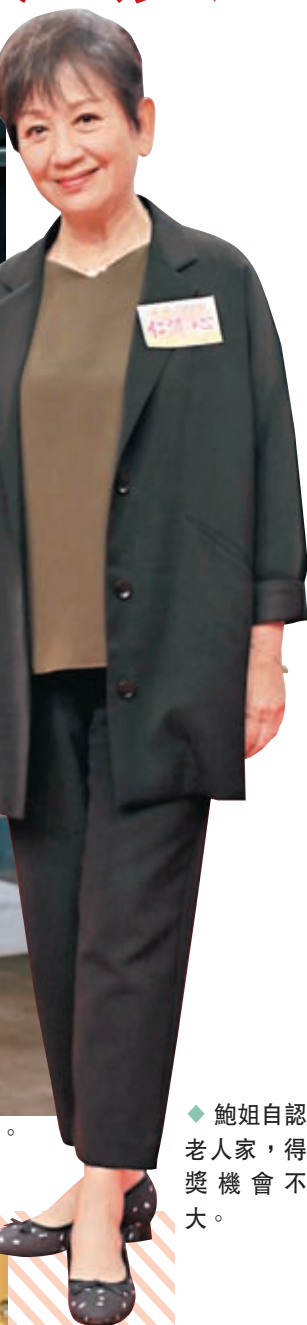
鮑姐自認老人家,得獎機會不大。