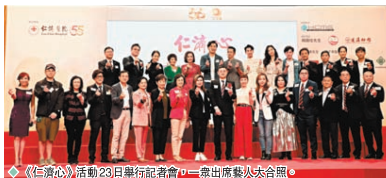
《仁濟心》活動23日舉行記者會,一眾出席藝人合照。