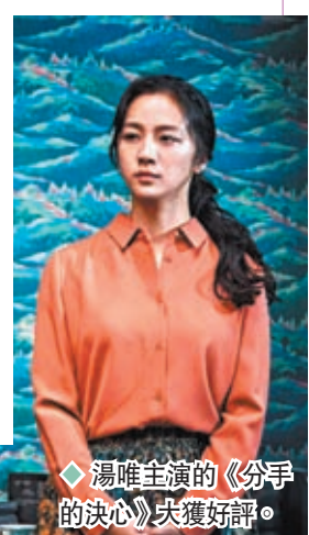
湯唯主演的《分手的決心》大獲好評。

香港文匯報訊(記者 文芬)韓國藝術評論家協會評選的第42屆年度最優秀藝術家名單最新出爐,內地演員湯唯憑主演《分手的決心》入選。頒獎典禮將於12月9日舉行。年度最優秀藝術家獎創立於1980年,該獎項每年都會在舞蹈、文學、戲劇、電影、音樂、傳統服裝等14個領域評選年度最優秀藝術家進行頒獎。湯唯的入選評語:電影部門年度最優秀藝術家為湯唯,她在朴贊郁導演的《分手的決心》中飾演瑞萊一角,用演技演繹出了從冷淡又孤單再到明媚春日般的變化,展現了令人印象深刻的表情演技和多樣的狀態。在第43屆韓國青龍電影獎,《分手的決心》亦獲13項提名,湯唯亦有份競逐女主角獎。