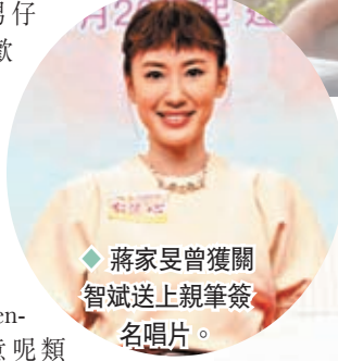
蔣家旻曾獲關智斌送上親筆簽名唱片。