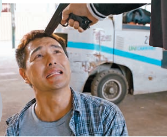
陳展鵬參演《超能使者》演技受人關注。