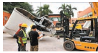
◆ 會徽雕塑局部製作中。