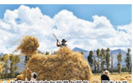
◆ 拉薩市位列空氣質量名單第一。圖為拉薩市林周縣的村民在藍天下收集糞肥。

1至10月，汾渭平原11個城市平均優良天數比例為66.6%，同比下降4個百分點；PM2.5平