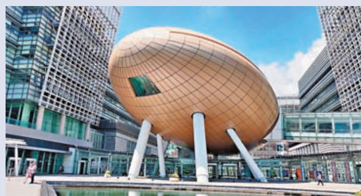
◆ 香港科學園目前提供約430萬平方呎的總樓面面積,主要為研發設施及實驗室,以及辦公室等配套設施,涵蓋約900間科技企業。

雖然香港在全球創新指數的基礎建設排名中名列前茅,但事實上,接近1,800間創科企業大部分都集中在香港