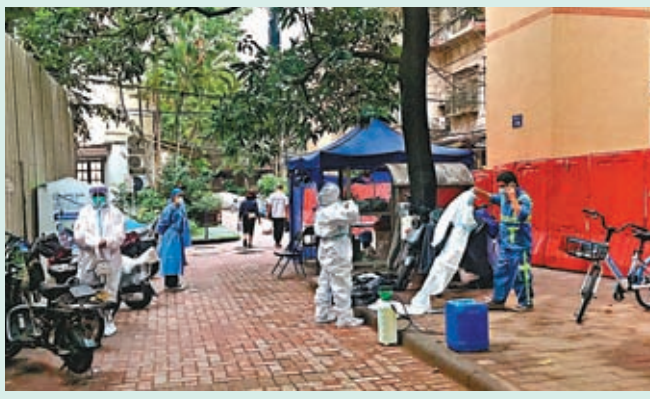
◆22日被列為高風險地區的海珠區穗花二巷7號，工作人員在圍欄外開展工作，剛從菜市場買菜回來的居民從這裏路過。