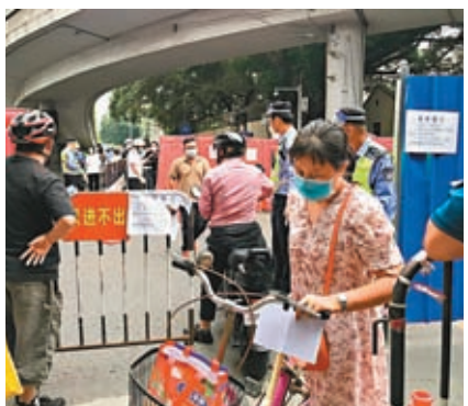
◆海珠區居民憑出入證明紙外出。

很多。事實上，政府推出防疫政策、具體執行是很精準的，比如高風險區劃定範圍小而精，對其他樓棟的居民幾乎沒有什麼影響，與疫情之初甚至去年，不可同日而語。」