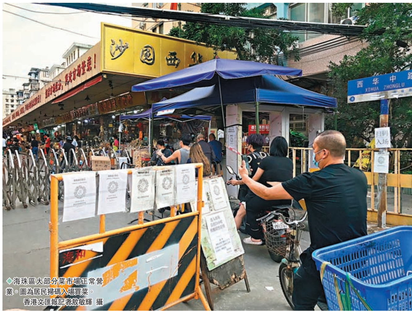
◆海珠區大部分菜市場正常營業。圖為居民掃碼入場買菜。