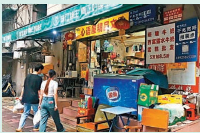
◆海珠區被列為高風險區的某棟樓一側，便利店正常營業。