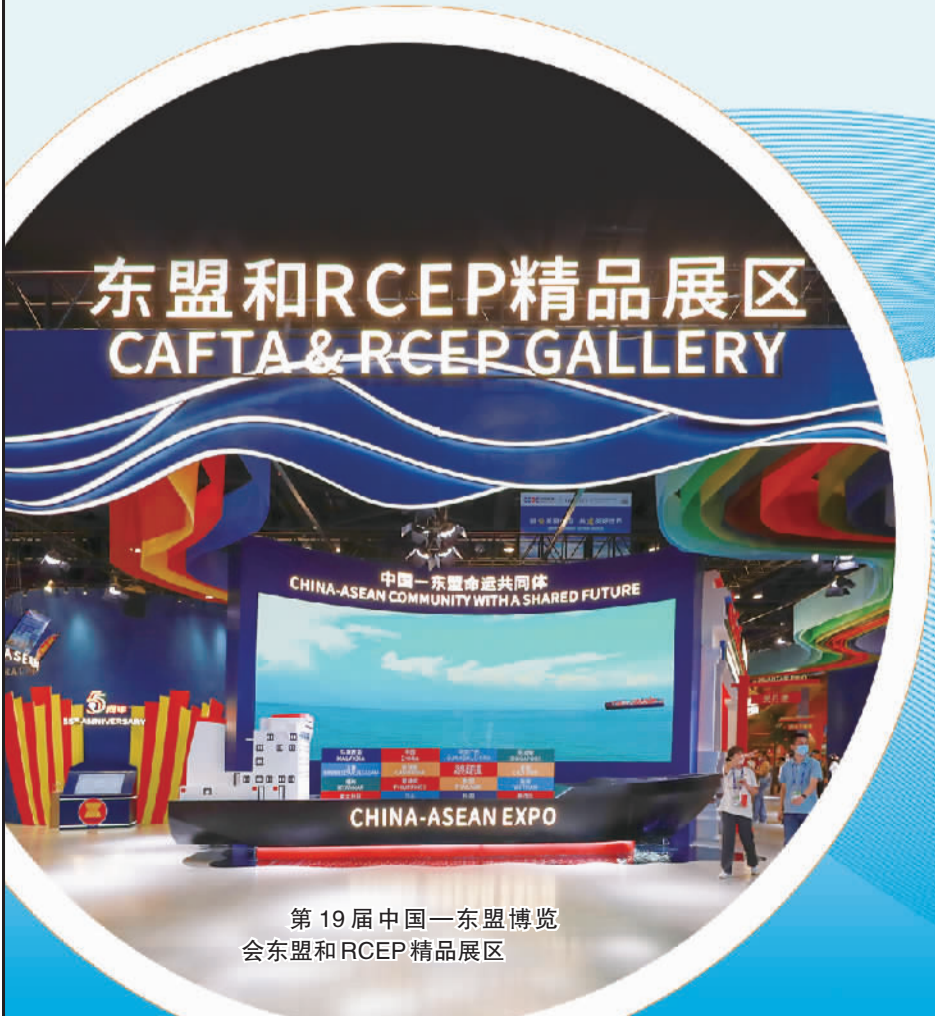
第19届中国—东盟博览会东盟和RCEP精品展区