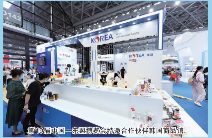
第19届中国—东盟博览会特邀合作伙伴韩国商品馆