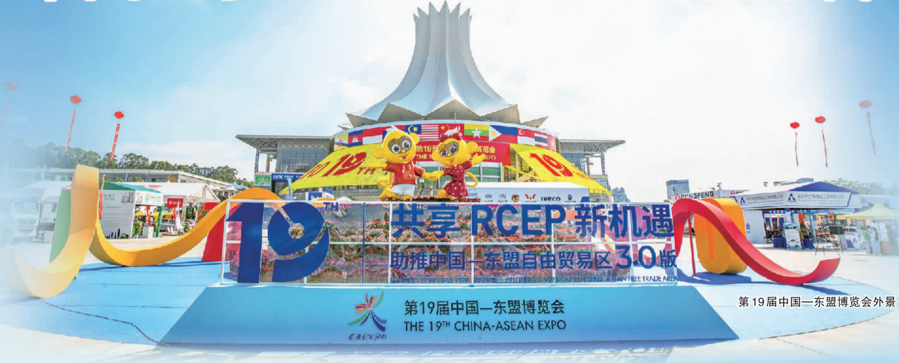
第19届中国—东盟博览会外景

中国—东盟博览会(简称“东博会”)是中国与东盟10国政府经贸主管部门及东盟秘书处共同主办的国际经贸盛会,至今已成功举办19届,成为中国—东盟重要的开放合作平台,为推动中国—东盟乃至东亚地区经贸合作全面发展发挥着越来越重要的作用。