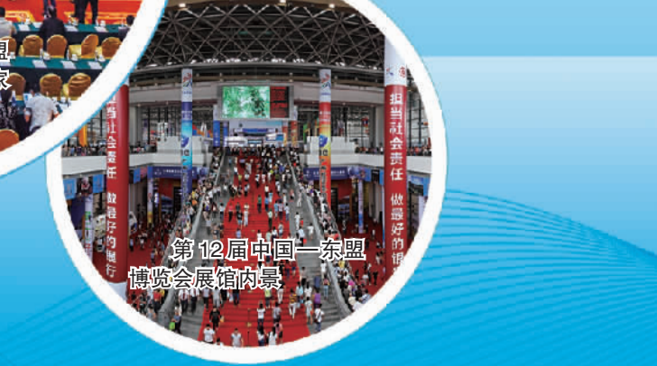
第12届中国—东盟博览会展馆内景