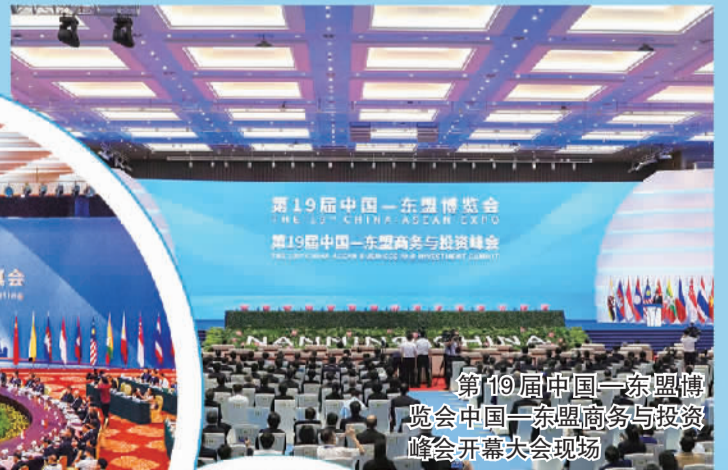
第19届中国—东盟博览会中国—东盟商务与投资峰会开幕大会现场