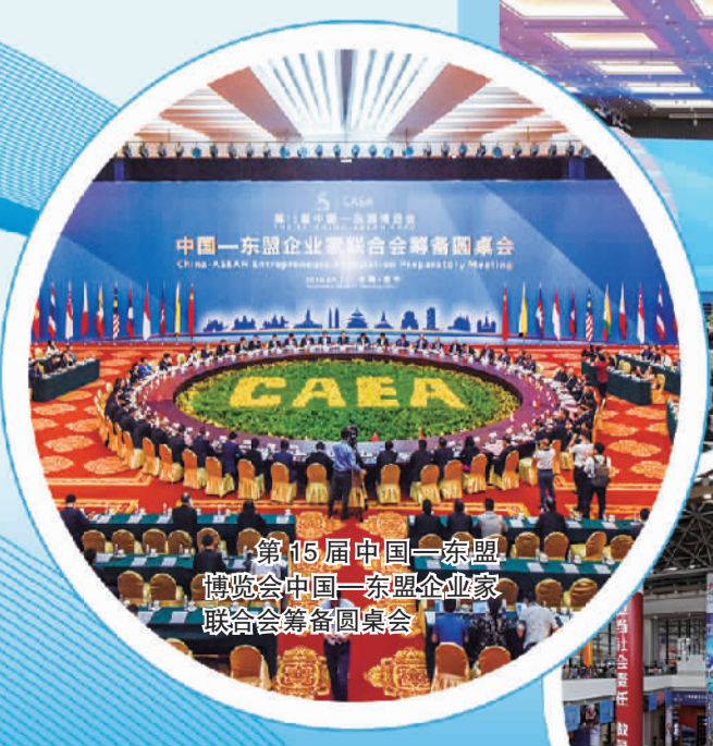
第15届中国—东盟博览会中国—东盟企业家联合会筹备圆桌会