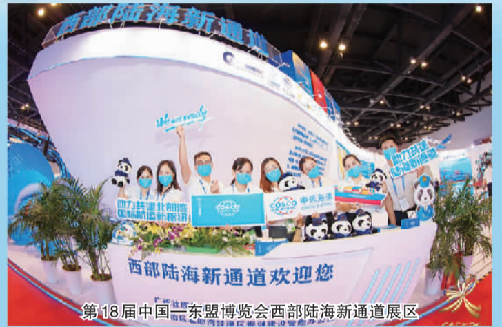
第18届中国—东盟博览会西部陆海新通道展区