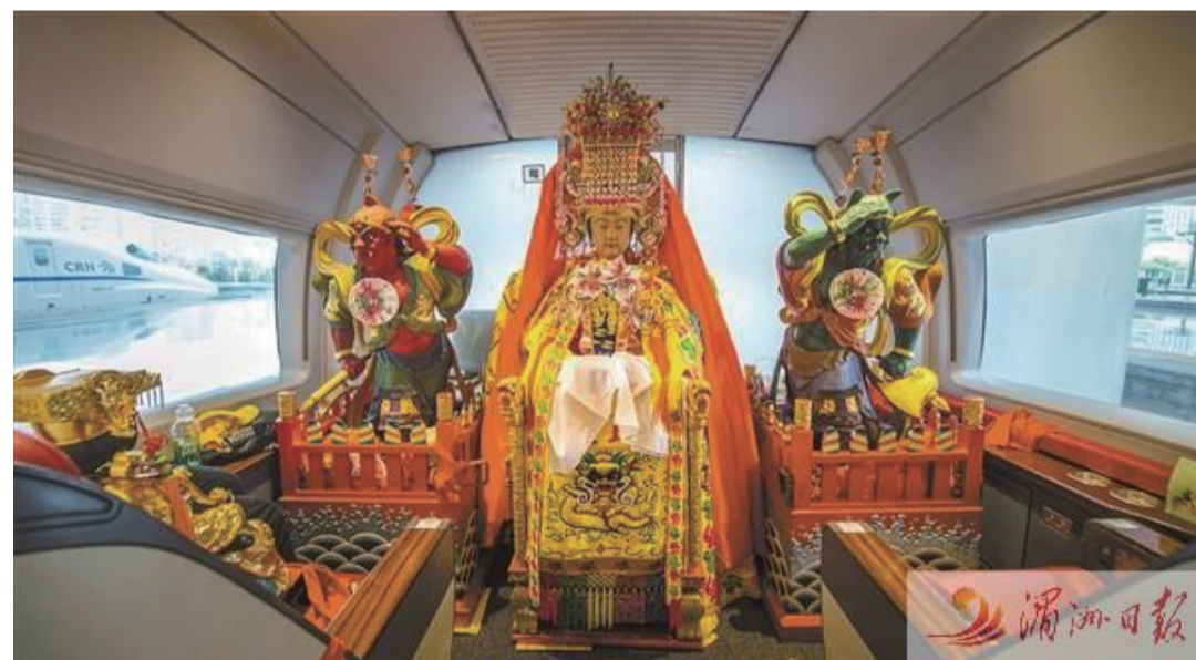
2019年,媽祖金身從湄洲島媽祖祖廟出發,乘動車移駕江蘇和上海開展巡安布福活動。

北宋宣和四年(1122),官員路允迪奉旨出使高麗,在東海遭遇大風,船艙紛紛傾覆,祇剩路允迪的船還沒翻。他連忙求天庇佑,接著就見一名身著紅衣的神女出現在桅杆上,路允迪磕頭請求幫助,風波隨之止息,同行者說這是莆田聖墩人信仰的湄洲神女顯靈。1123年,聽聞相關奏報的宋徽宗遂下旨為聖墩媽祖廟賜“順濟”匾額。這個故事被稱為“朱衣着靈”,是媽祖首次得到皇帝的認可,一舉奠定了媽祖成為國家海神的