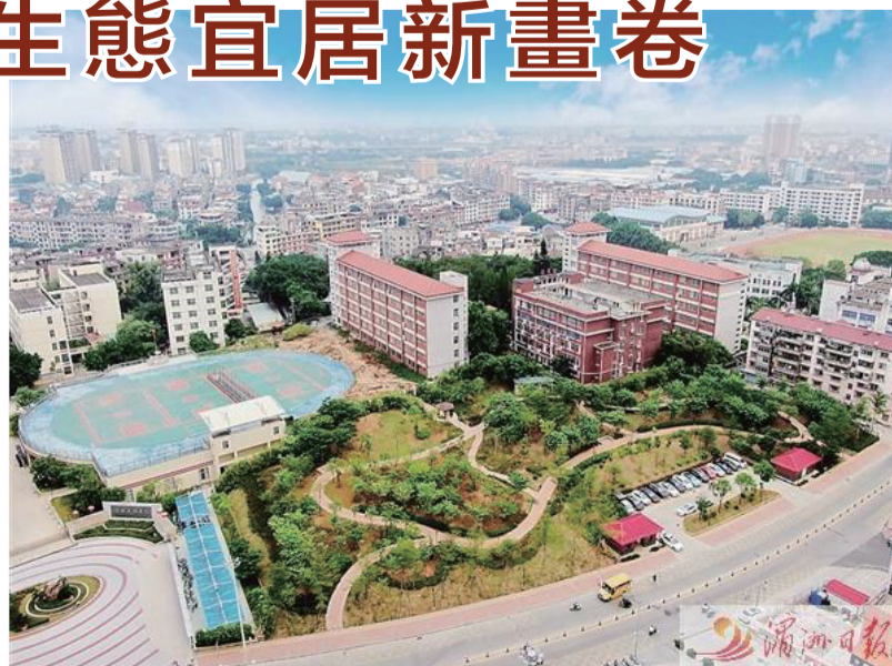
位於涵江城區的青璜口袋公園,為轄區居民提供了風景優美的活動場地。

全市首個海綿城市理念啤酒特色主題公園、全市首批智慧體育公園等一批高品質園林綠化項目建成投用,建設囊山森林公園、白塘湖公園、西河公園、城涵河道等11個城市綜合性公園,成為涵江一張張響亮名片。這些公園的建設,提升城市功能和品位,改善城市環境,為居民提供更加生態、親水、宜人的休閒娛樂場所。