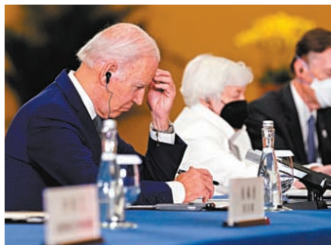
◆拜登總統專注傾聽，不時低頭記錄。