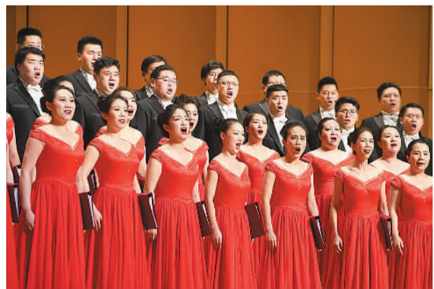
▲国家大剧院合唱团放歌北大。

“歌唱我们亲爱的祖国，从今走向繁荣富强……”11月7日晚，在全场千余名观众高唱《歌唱祖国》的歌声中，“荣光与梦想”国家大剧院合唱团音乐会在北京大学百年纪念讲堂圆满落幕。