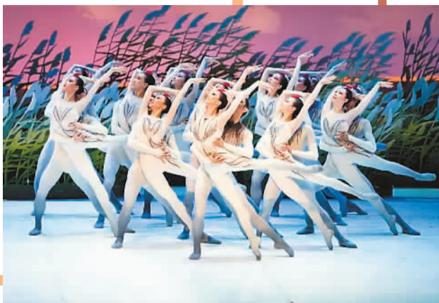
▲中央芭蕾舞团《鹤魂》