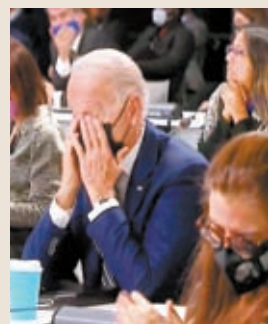
◆拜登在去年氣候峰會被拍到打瞌睡。