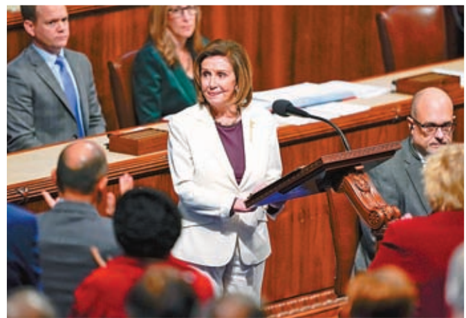
佩洛西較早前宣布引退。