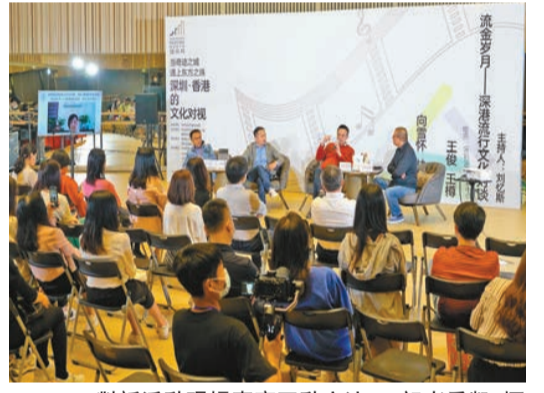
對話活動現場嘉賓互动交流。