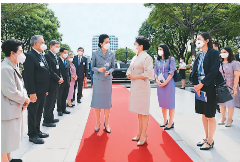
当地时间11月19日上午,国家主席习近平夫人彭丽媛在泰国总理夫人娜拉蓬陪同下参观甘拉雅尼音乐学院。这是彭丽媛抵泰时,娜拉蓬等热情迎接。

彭丽媛抵泰时,娜拉蓬及泰国高教科研与创新部部长阿内、有关内阁部长夫人、甘拉雅尼音乐学院理事会主席比亚沙坤、院长初维等热情迎接。学院乐队奏响欢快的鼓乐,学生们挥动鲜花夹道欢迎。彭丽媛与娜拉蓬共同参观学院陈列室,认真听取学院发展历史和对外合作情况介绍,为学院与南京艺术学院建立和发展合作感到高兴。