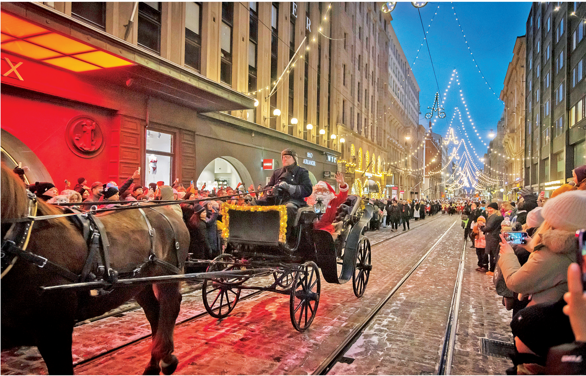
芬兰赫尔辛基举行圣诞节亮灯仪式 11月19日，人们在芬兰赫尔辛基参加圣诞节亮灯仪式和花车巡游活动。当日，芬兰首都赫尔辛基市举行圣诞节亮灯仪式和花车巡游活动。圣诞节亮灯仪式是赫尔辛基历史悠久的圣诞庆祝活动，每年吸引大量观众。