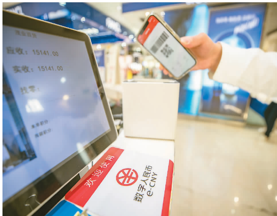
消费者在重庆市江北区观音桥商圈茂业天地百货商场收银台使用数字人民币进行支付。

中国人民银行发布的《中国数字人民币的研发进展》白皮书介绍,中国电子支付尤其是移动支付快速发展,为社会公众提供了便捷高效的零售支付服务,也培育了公众数字支付习惯。据了解,数字人民币坚持“安全普惠、创新易用、长期演进”的理念,并逐渐拓宽应用的新渠道、新载体、新场景,在包括批发零