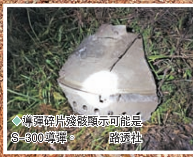
◆導彈碎片殘骸顯示可能是S-300導彈。