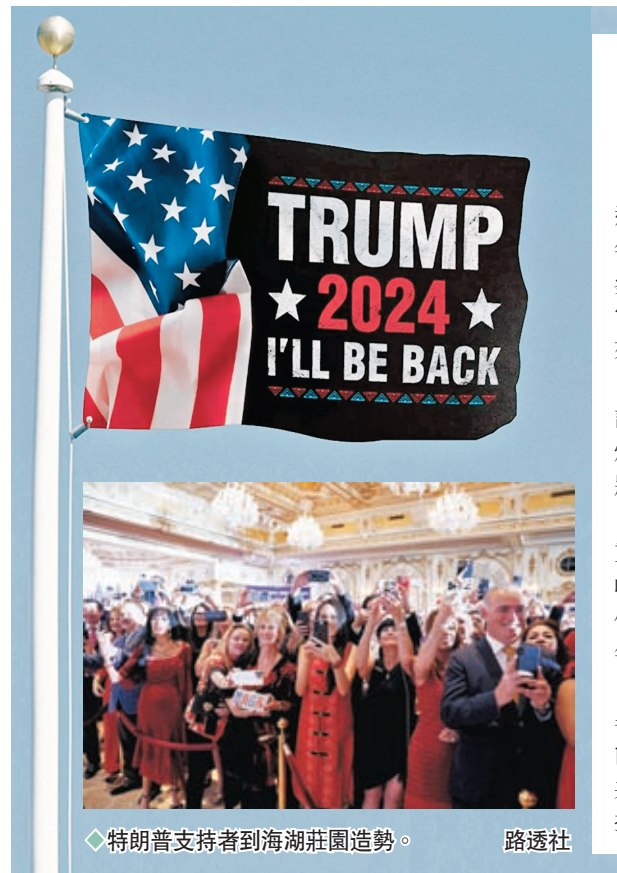
◆特朗普支持者到海湖莊園造勢。

S-300是蘇聯時期提升全空域作戰與防禦能力而研發的地對空導彈系統，至今已服役36年，參與過敘利亞和俄烏戰爭的多個防空實戰，同時也是俄羅斯的主要防空系統，最新版S-300V4射程最遠可達400公里。 ◆綜合報道