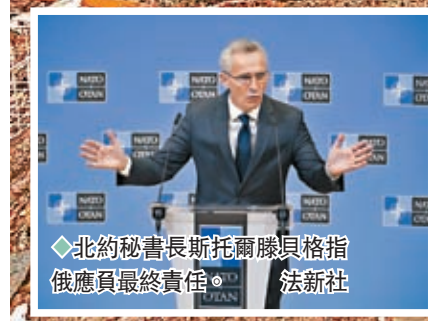
◆北約秘書長斯托爾滕貝格指俄應負最終責任。