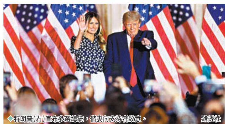
◆特朗普(右)宣布參選總統，偕妻向支持者致意。