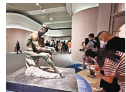
「意大利之源——古羅馬文明展」7月在北京開幕，展覽現場人潮湧湧。

2019年，習主席訪問意大利時，兩國領導人達成舉辦「中國意大利文化和旅遊年」的共識。後來，受疫情影響，雙方一致同意將2020「中國意大利文化和旅遊年」活動順延到今年舉辦。今年7月，「意大利之源——古羅馬文明展」在北京開幕，兩國領導人致信祝賀。