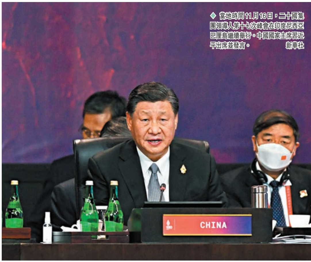
當地時間11月16日，二十國集團領導人第十七次峰會在印度尼西亞巴厘島繼續舉行。中國國家主席習近平出席並發言。