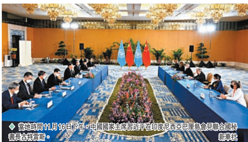
當地時間11月16日下午，中國國家主席習近平在印度尼西亞巴厘島會見聯合國秘書長古特雷斯。