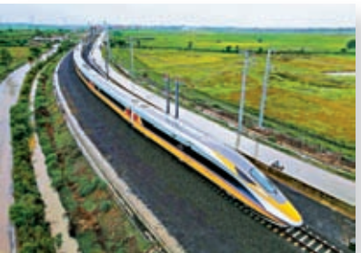
雅萬高鐵是中國和印尼務實合作的「首要旗艦項目」。

烏鎮峰會致賀信時指出，面對數字化帶來的機遇和挑戰，國際社會應加強對話交流、深化務實合作。