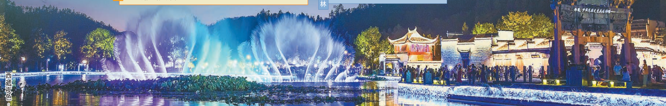
西遞夜色。