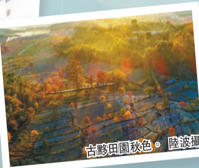
古黟田園秋色。