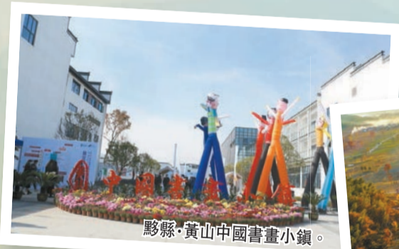
黟縣·黃山中國書畫小鎮。

協辦單位：安徽省攝影家協會、黃山市攝影家協會、黟縣攝影家協會、黟縣徽黃旅遊發展集團有限公司、黟縣徽黃京黟旅遊發展有限公司、黃山屏水文化旅遊有限公司