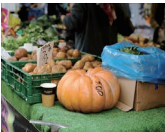
新華社北京11月15日電——一項調查顯

示，英國人如今邀請朋友到家中聚餐時，不再像從前那樣在廚房裏準備各種大菜。不少人認為，吃用微波爐加熱的速凍食品就足夠了，他們希望把更多時間花在與朋友相處上。