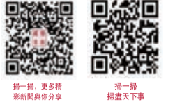
掃一掃，更多精彩新聞與您分享