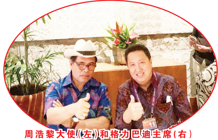
周浩黎大使(左)和格力巴迪主席(右)