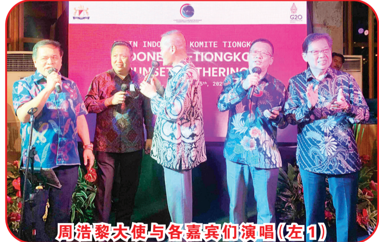
周浩黎大使与各嘉宾们演唱(左1)