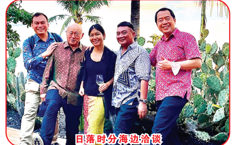
日落时分海边洽谈