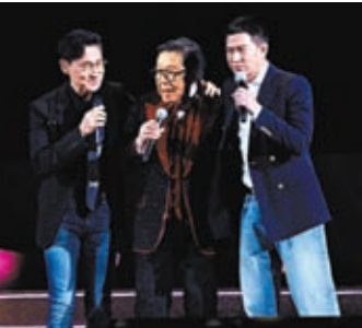
◆張學友、張家輝為契爺胡楓合唱一曲。

楓驚喜，胡楓兩個孫女，帶着4名年幼曾孫子女與他合唱，溫馨幸福，壓軸出場的張學友令胡楓喜極而泣，歌神更向他下跪、擁抱，充滿温情，可見胡楓在圈中備受敬重。很少見到觀眾席上這麼多銀髮族，不少撐着拐杖，或由人攙扶也要入場，除了是胡楓資深粉絲外，更因胡楓給他們一個指標：高齡也可活出精彩。 第三個好騷是在亞洲國際博覽館舉行的拉闊音樂會，鄭欣宜與拍檔勁歌熱舞，極為合拍，Showmanship一流，粉絲尖叫揮動燈牌回應，樂壇少有唱跳歌手，欣宜身體柔軟，節拍感強，每一下擺動都令氣氛更熱爆。下次她再開個唱，必掀搶飛潮。開騷前雖知拍檔身體不適，心裏擔憂，但未影響演出，表現出色，有藝人的The show must go on專業精神，讚！