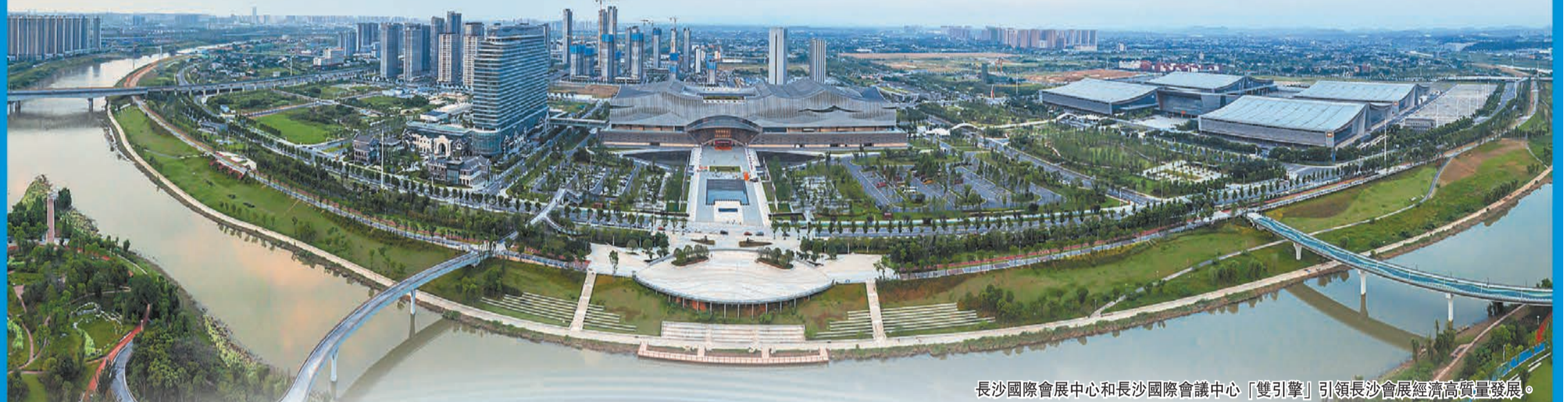
長沙國際會展中心和長沙國際會議中心「雙引擎」引領長沙會展經濟高質量發展。

11月4日，湖南長沙北辰國際會議中心，2022世界計算大會在此拉開大幕，以「計算改變生活，科技賦能未來」為主題的專題展成為亮點。各類頭部企業的高科技產品，通過計算前沿技術、硬件終端設備、軟件信息服務及典型應用場景進行集中展示。億達科創作為中國領先、國際化的IT服務及數字化解決方案提供商，受邀參加此次專題展。