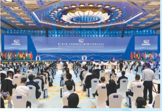
中非經貿博覽會長期落戶湖南，是湖南第一個國家級、國際性對外開放平台。

「在建設全國統一大市場的背景下，長沙作為中部地區核心城市、長江經濟帶中心城市、「一帶一路」重要節點城市，中部崛起、粵港澳大灣區等多個國家戰略聚焦，這將為長沙會展業發展集聚更多資源要素、贏得更大發展空間。」長沙會展辦相關負責人說。