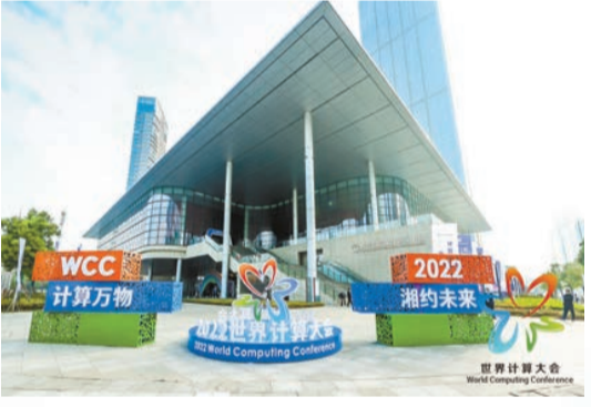
2022世界計算大會於11月4日—5日在長沙北辰國際會議中心舉行。

為，牢牢掌握發展主動。中非經貿博覽會、中國國際食品餐飲博覽會、中國國際軌道交通和裝備製造產業博覽會、博鰲亞洲論壇全球經濟發展與安全論壇、北斗規模應用國際峰會、長沙國際工程機械展……一個個響亮的世界級、國家級品牌展會，讓長沙不斷開放懷抱、走向世界。