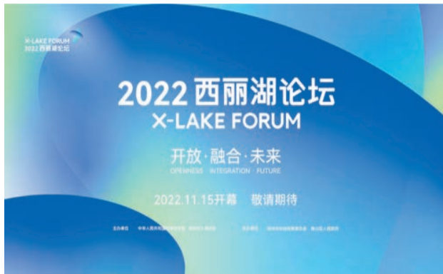
2022 西麗湖論壇海報。主辦方供圖

【香港商報訊】記者陳彥潔報導：2022西麗湖論壇將於今日上午在深圳大學城國際會議中心開幕，與第二十四屆高交會同期舉行。論壇圍繞「創新·可持續發展」的永久主題，聚焦「開放 融合 未來」三個關鍵詞，邀請中外各界專家學者齊聚一堂，共議開放融合發展趨勢、共享前沿科技創新成果、共擔科技自立自強責任使命。