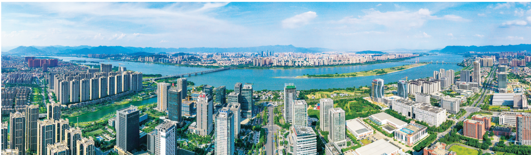
福州高新技术产业开发区。