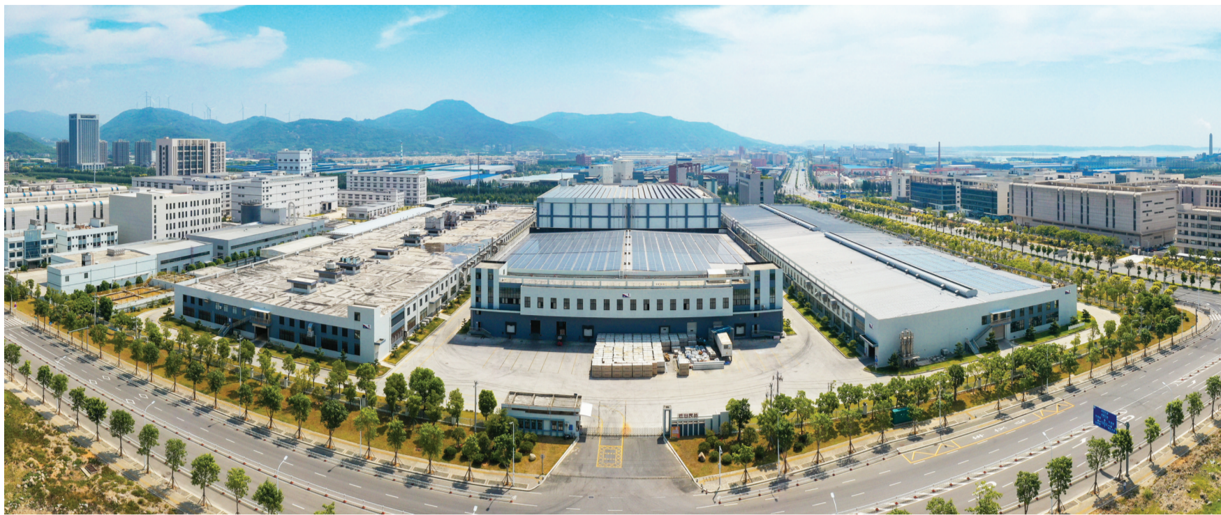
“两国双园”中方园区中的京东元洪食品数字经济产业中心。

“对外开放是福州经济发展的重要动力”“福州只有大开放,才能加快发展”。近年来,沿着习近平总书记20世纪90年代初科学谋划实施的“3820”战略工程为福州擘画的宏伟蓝图,福州积极融入“一带一路”建设,强化区域交流合作,加快建设现代化国际城市。