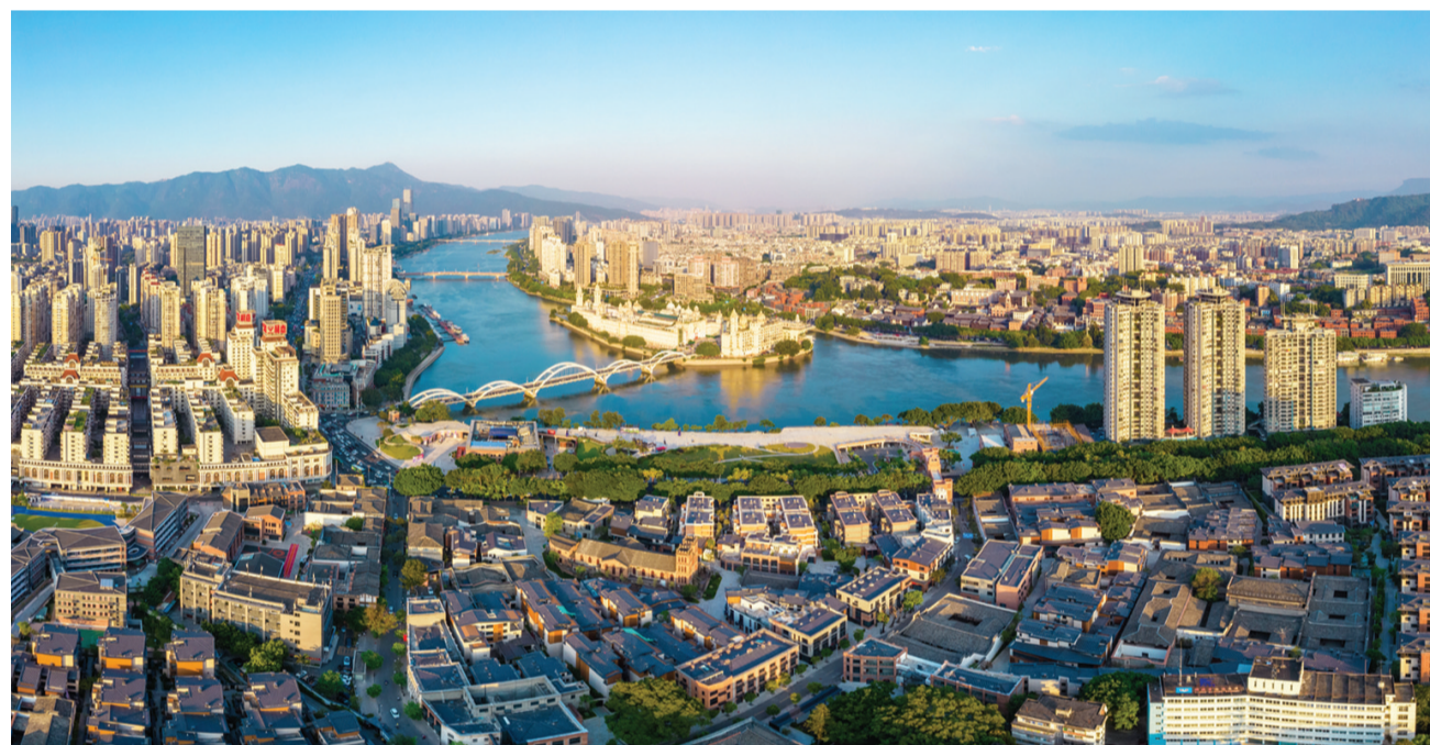
闽江之心核心区。

福州地处中国东南沿海,是福建省省会,也是海上丝绸之路的重要发祥地。现辖6区1市6县,总面积1.2万平方公里,城市规划区面积4792平方公里,建成区面积354平方公里,常住人口842万。主要有7个特点: