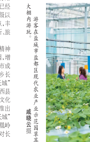
游客在盐城市盐都区现代农业产业园草蓆大棚内游玩。

近年来，盐都区以创建国家全域旅游示范区为目标，整合农业旅游资源，开发农业生态旅游观光项目，把盐都最美的地方串珠成链，开启了春季踏青赏花、夏季亲水游玩、秋季进园摘果、冬季听曲看戏的全季全域旅游新模式，满足了周边城市市民微度假、周边