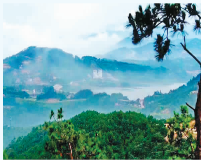
左下图：天台山一景。右下图：天台山的寺庙。

如今的天台山，寺院与道观的数量在县一级达到全国第一，既有省级的佛教教育机构浙江佛学院，也有省级的道教教育机构浙江道学院。那穿越千年的佛寺道观，隐藏着多少超脱凡尘的思绪；那缭绕于山间的云雾，似乎充满仙气，让人想象仙人的身影与足迹；那神采飞扬的云锦杜鹃，见证了天台山千百年来高僧高道大儒相继登场，书圣诗仙游圣先后到来。神奇的天台山，成就了博大精深的天台山文化。