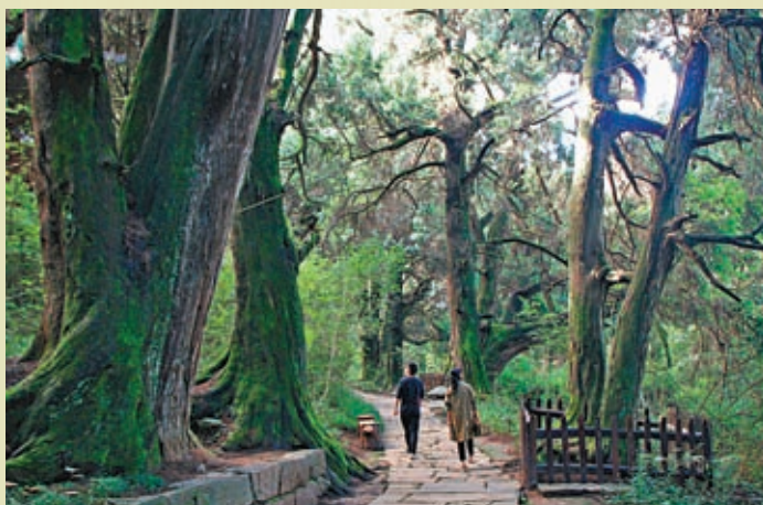
◆古柏林蟠根糾結、風姿各異