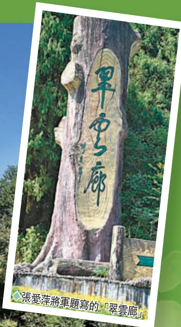
◆張愛萍將軍題寫的「翠雲廊」