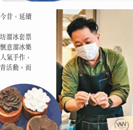
◆限定人氣手作工作坊，圖為3D花鑽香石。