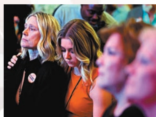
◆共和黨支持者流露失望神情。

這個現象反映了什麼？拜登在選後記者會上表示，相信選民會更加支持現任政府各項議程，揚言自己「不會從根本上改變任何事情」。拜登錯了，選舉結果並非代