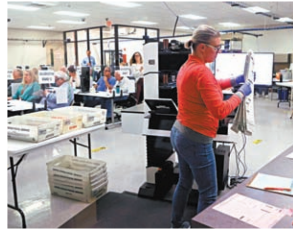
◆參院選舉下月才有完整結果。