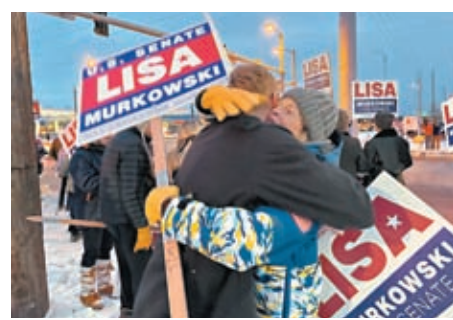
◆共和黨參議員候選人穆爾考斯基與親友相擁。