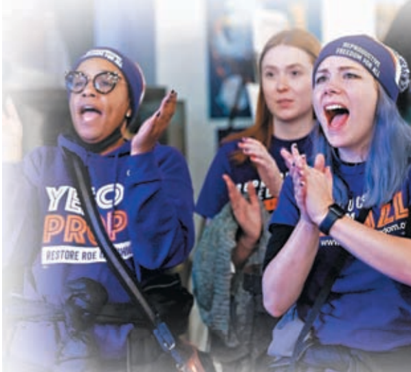
◆支持墮胎組織成員拍手歡呼。路透社