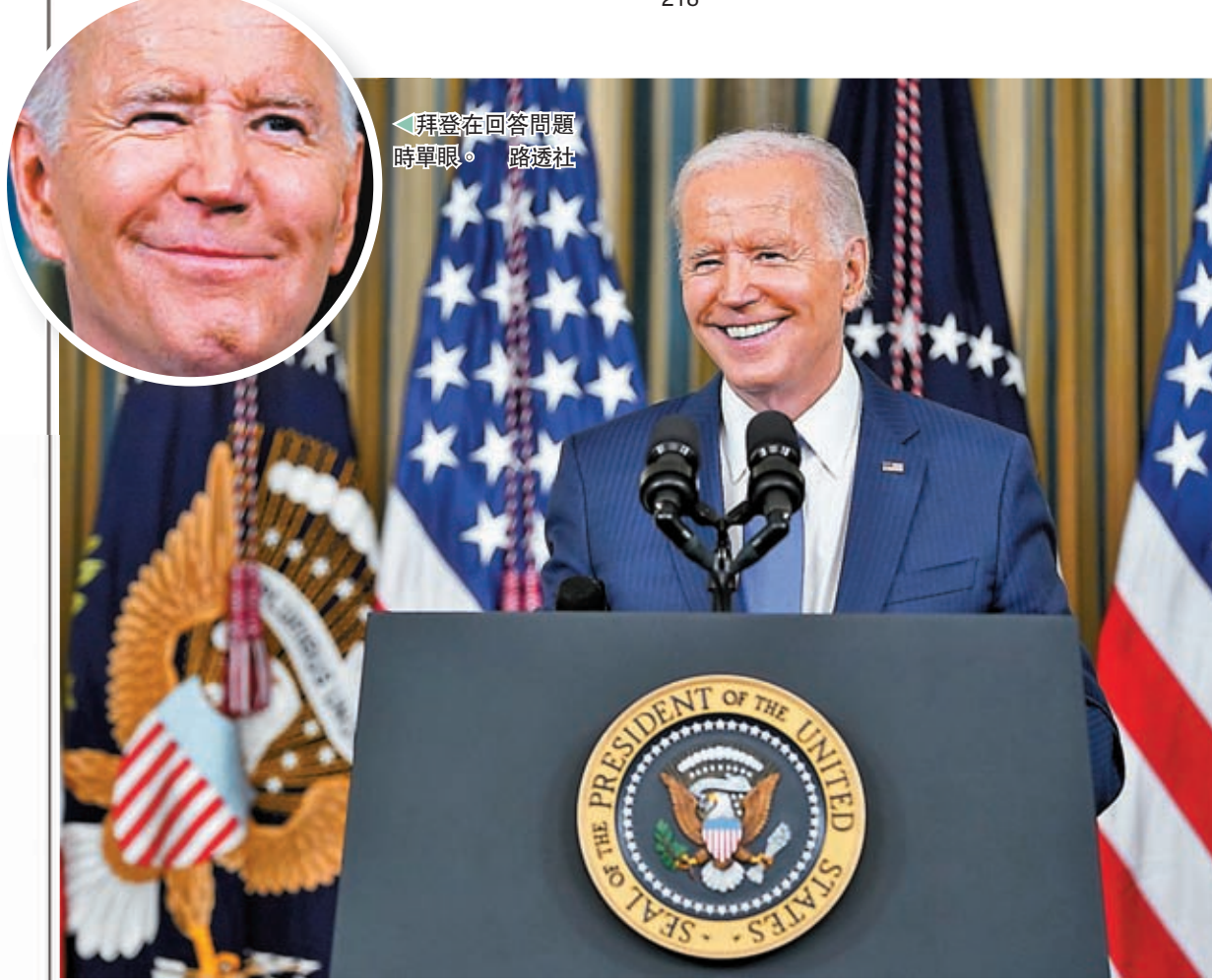
◆拜登在記者會上預告明年宣布競逐連任。