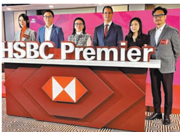
經歷了市場動盪和地緣政治挑戰之後，不少受訪者作出投資選擇比疫情之前更加謹慎，亦留意到有更多投資者選擇持有更多現金，不過他亦提到有不少新開設投資戶口，相信是投資者意識到不能只持有現金，多元資產配置同樣重要。