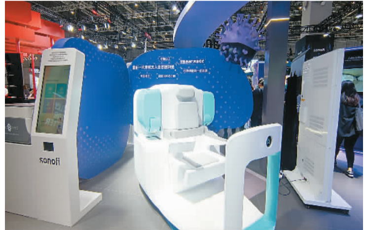
左图：新一代智慧无人疫苗接种舱亮相。