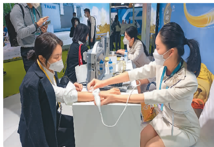
上图：工作人员正在帮参观者测骨密度。