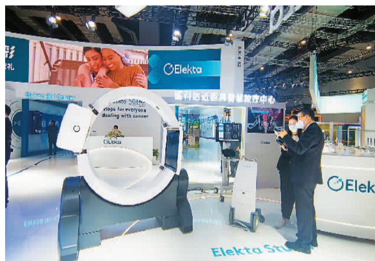
上图：工作人员在向观展者介绍Elekta Studio系统。