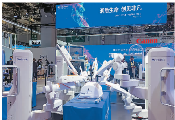
上图：美敦力在展示其Hugo RAS System机器人辅助手术系统。