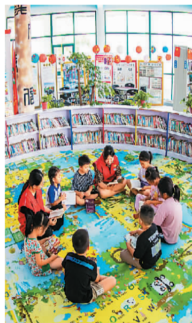
江苏淮安高新区文化志愿者在田庄村农家书屋与儿童一起阅读。 翟慧勇摄（人民图片）