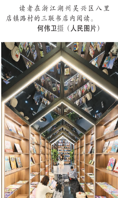
读者在浙江湖州吴兴区八里店镇路村的三联书店内阅读。