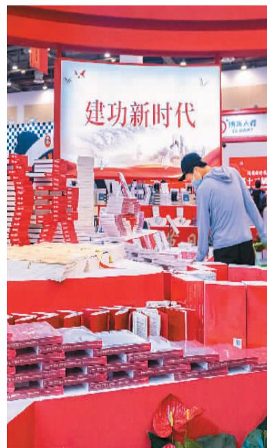
第十二届江苏书展现场，读者在选购图书。