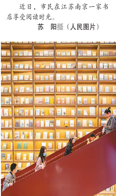
近日，市民在江苏南京一家书店享受阅读时光。