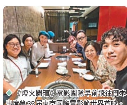
◆ 《燈火闌珊》電影團隊早前飛往日本出席第35屆東京國際電影節世界首映。