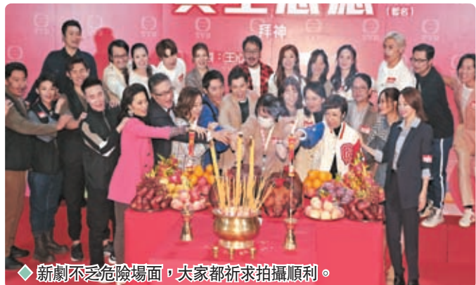
◆ 新劇不乏危險場面，大家都祈求拍攝順利。