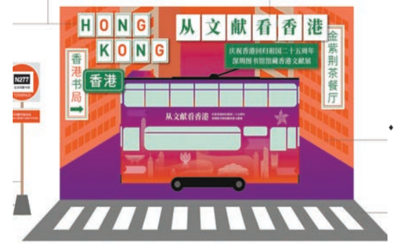
香港文獻展合影打卡點。

【香港商報訊】記者王靜杼、喬凱 通訊員李丹報道：昨日，由深圳市委宣傳部、深圳市文化廣電旅遊體育局指導，深圳圖書館主辦的「從文獻看香港——慶祝香港回歸祖國二十五周年深圳圖書館館藏香港文獻展」在深圳圖書館二樓樹銀樓展廳開幕。據悉，展覽將持續至12月8日。