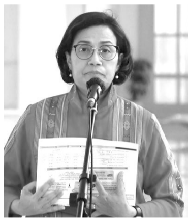
财政部长穆丽亚妮

【本报讯】目前，卷烟企业家舆论着明年卷烟消费税增加10%的问题。财政部长穆丽亚妮日前传达了提高烟草制品消费税10%的信息。