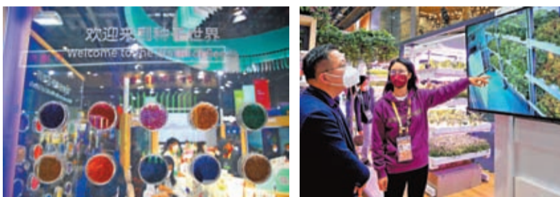
◆在今年進博會上, 種業企業展示的種衣劑。 工作人員向觀眾介紹「集裝箱裏種新中社菜」。