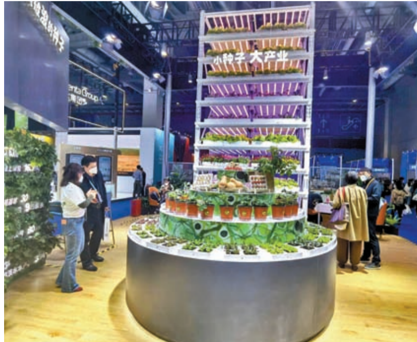
◆在進博會農作物種業專區, 展台展示了不少農作物產品。