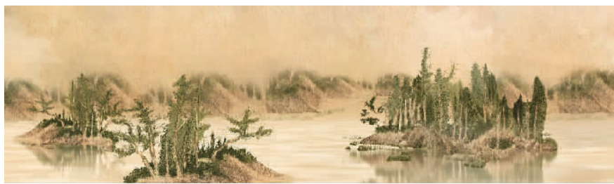
根据上海博物馆藏元代钱选《浮玉山居图》制作的舞台背景画面。

近日，上海博物馆与上海民族乐团跨界合作，在上海音乐厅举办“海上生民乐——上海博物馆建馆70周年文物民乐展演”。国宝与国乐交相辉映，喜迎上海博物馆和上海乐团的七十年诞。 展演分为“海上雅集”“民乐表演”两部分。“海上雅集”由主持人曹