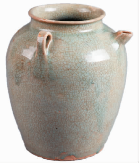
唐代水车窑青釉双系壶。

为了给观众带来精彩的参观体验，广东中国客家博物馆引入VR、AR等先进技术，并设置了多个互动体验项目。在讲解服务上，运用人工讲解、智能语音讲解、定点感应讲解、手机导览等多种方式，满足各类型观众的观展需求。