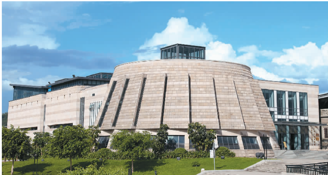
广东中国客家博物馆主馆外观。