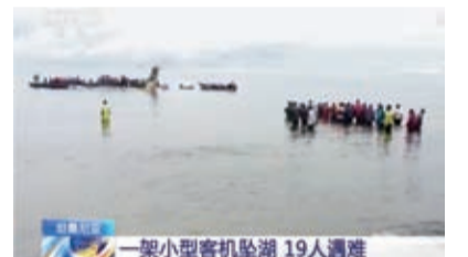
一架小型客機墜湖 19人遇難