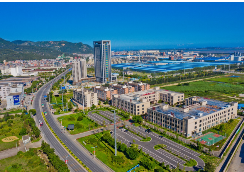
福清元洪国际食品产业园。

目前,中印尼“两国双园”新旗舰项目已被列入中国国家发改委“一带一路”海丝核心区建设方案重大平台之一,中国商务部“十四五”商务发展规划和对外贸易高质量发展规划。