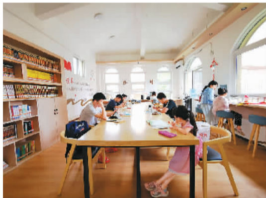
图片从上至下依次为：中国文字博物馆、被誉为“一片甲骨惊天下”的小屯南地甲骨、甲骨文书屋、文创产品甲骨文魔方。