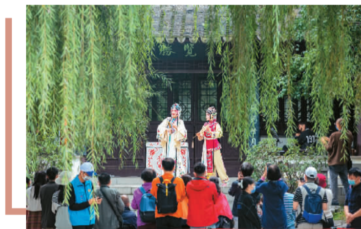
戏曲周活动现场。

为了给广大戏曲爱好者搭建展示交流、互动参与的平台，本届戏曲周还拓展了中国戏曲票友大赛的时空范围，持续推进“戏炫生活共享小康”以及“小戏台”“嬉戏”亲子剧场等群众性戏曲常态活动，打造不落幕的戏曲周。