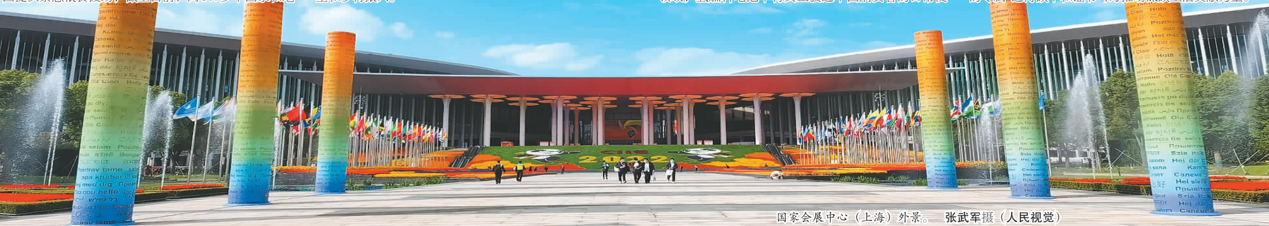
国家会展中心(上海)外景。

个人也能积极参与碳减排。据了解,本届进博会推出“零碳进博·零塑进博”碳普惠行动计划,现场展商、观众等均可通过进博会线上平台,估算出参加本届进博会所搭乘的主要交通工具产生的碳排放量,再以购买碳资产注销的方式实现“碳抵消”。最多只需支付1元钱,参与者即可完成碳抵消并获得上海环境能源交易所颁发的专属“进博碳中和证书”,为推动低碳生活贡献力量。